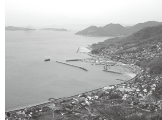
青佐山第一展望台より※正頭漁港方面を望む ※海見える家=まちづくり拠点予定

注) 希望の事業の部会を選んでください。複数でも結構です。提出済みの方は不要です。 8月初旬に部会を開きます。中途で入れられてもよろしいので誘いあわせご参加下さい。