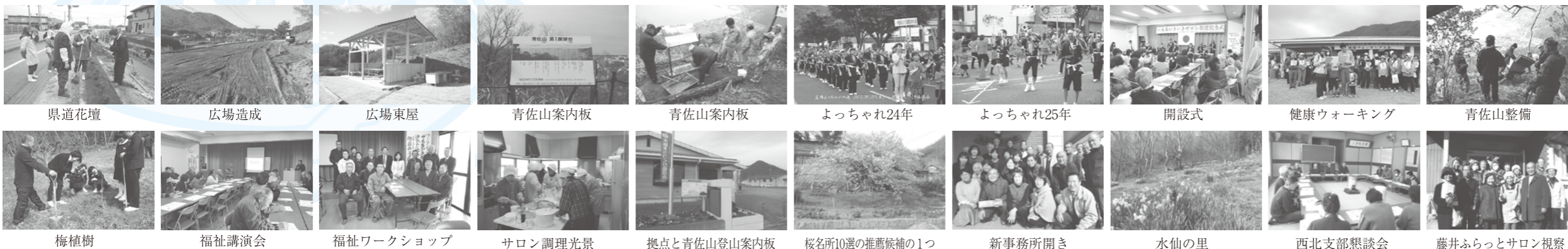
県道花壇 広場造成 広場東屋 青佐山案内板 青佐山案内板 よっちゃれ24年 よっちゃれ25年 開設式 健康ウォーキング 青佐山整備 梅植樹 福祉講演会 福祉ワークショップ サロン調理光景 拠点と青佐山登山案内板 桜名所10選の推薦候補の1つ 新事務所開き 水仙の里 西北支部懇談会 藤井ふらっとサロン視察

「笑夢ふ分か助ささま 顔のれかけさえさえ 家族の拓く愛愛愛 大島」 まちづくり 愛ことは