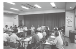
平成25年度通常総会