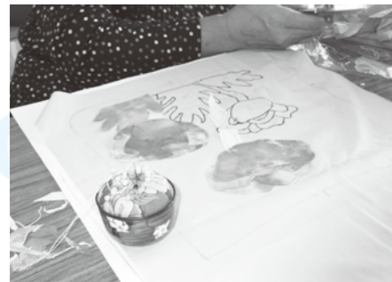
バッグづくり手芸