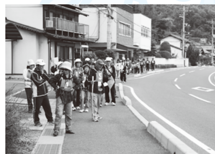
ふれあいウォーキング